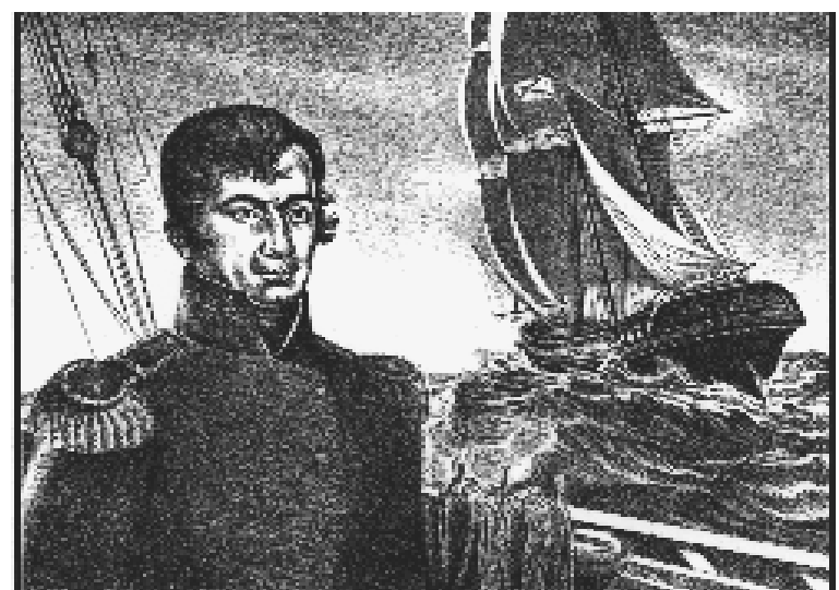
6. И.Ф. Крузенштерн на "Надежде" в первой кругосветке